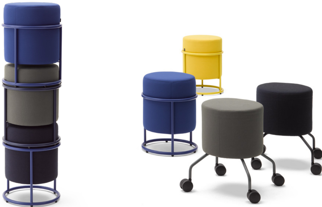
Produktfamilie Product family

Drop by Pauline Deltour is the name of a whole family consisting of a mobile roller stool, a stackable stool, a large pouf, benches, bar stools, bar table and a side table. The small components are mobile, while the larger ones form a meeting point in the office or at home. What they all have in common is that they are laid-back. A round, fully visible steel frame enfolds each upholstered body. Tone in tone. Four legs with rollers turn the small stool into the office runabout – an incredibly practical colleague. The perfect additive for a mobile working environment. “I share my office with friends,” says the French designer, “and on holiday I use Airbnb.” It is precisely this lightness and joy that Drop emanates. A dash of French savoir vivre.